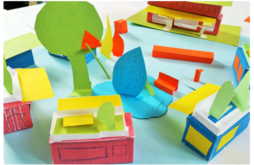
Die Wohnwerkstatt hat auch Kreativseminare im Angebot: Da wird dann schon mal mithilfe von buntem Papier das ideale Wohnumfeld entworfen.

Auch Karin Breunig wünscht sich mehr Vielfalt in den Wohnangeboten. Sie ist Mitglied im Beirat für Menschen mit Behinderung und erfährt täglich, dass Wohnraum für behinderte Menschen fehlt. „Gerade junge Menschen, die selbstbestimmt leben möchten, fallen oft durchs Raster“, sagt sie und erzählt von jungen Menschen mit Behinderung, die in Altenpflegeeinrichtungen betreut werden,