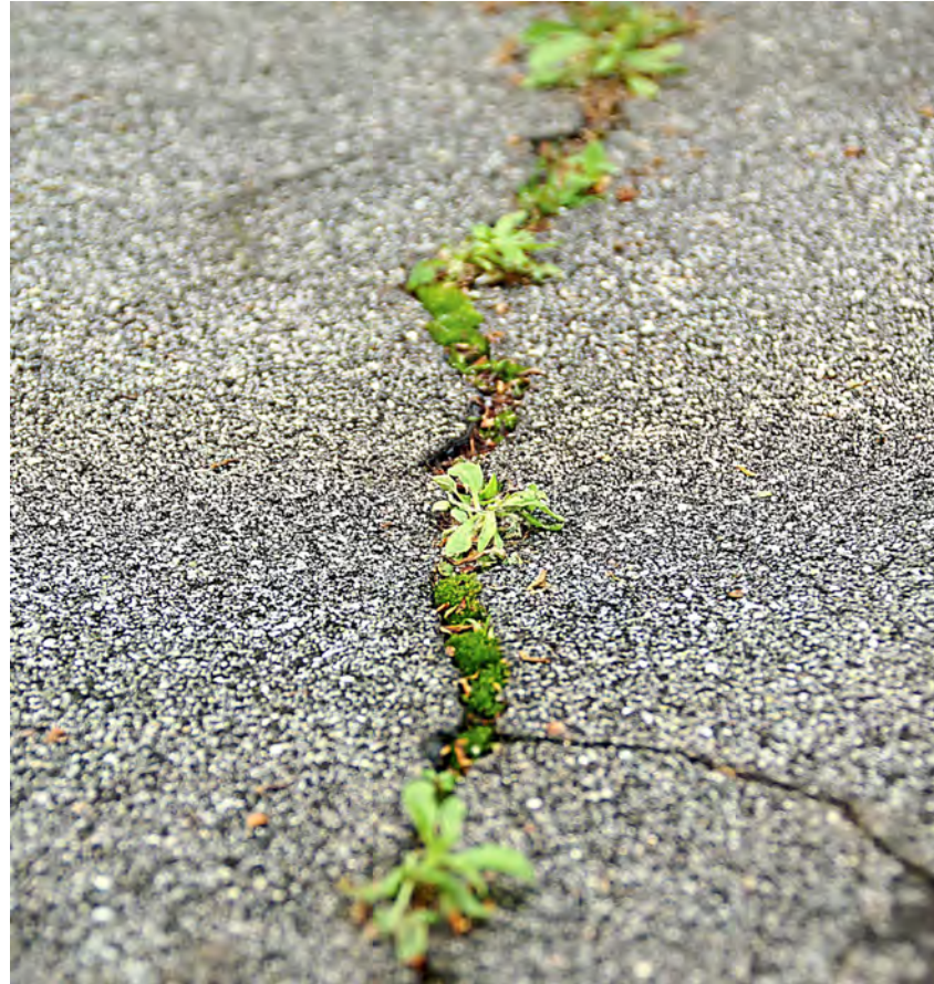
Auch durch die Gesellschaft ziehen sich immer mehr Risse. Können sie nicht repariert werden, droht der Totalschaden.