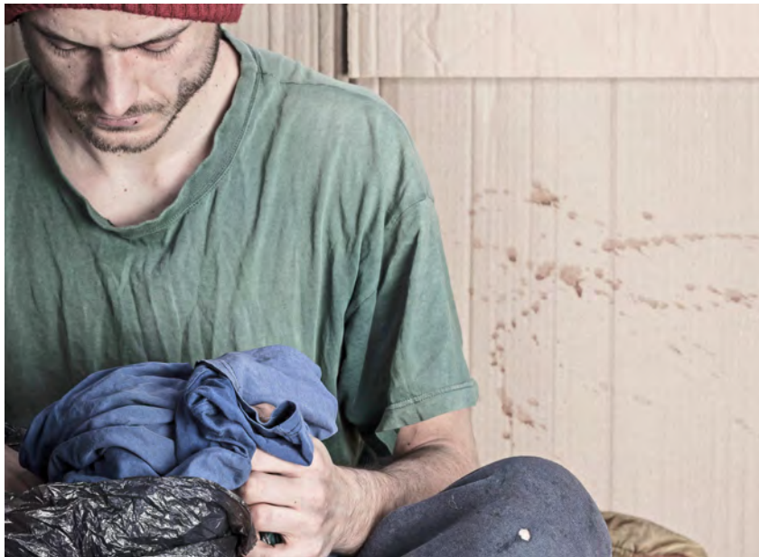
Allein in Süddeutschland sind vermutlich mehr als 40.000 Menschen ohne eigene Wohnung, Tendenz steigend.

Während der Corona-Pandemie wurden die Bedürfnisse der Obdachlosen nicht ausreichend berücksichtigt, kritisiert Simon Näckel. Erst fehlte es an Masken, dann an Tests und Impfungen. Und auch sonst ist für Wohnungs- und Obdachlose vieles komplizierter geworden. „Corona hat zu massiven Einschnit-