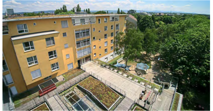
Das Wichernhaus im Karlsruher Stadtteil Mühlburg wurde 2007 neu eröffnet und bietet 52 Pflegeplätze.

Auch die Bewohner:innen profitieren von Pflegekräften aus der ganzen Welt.