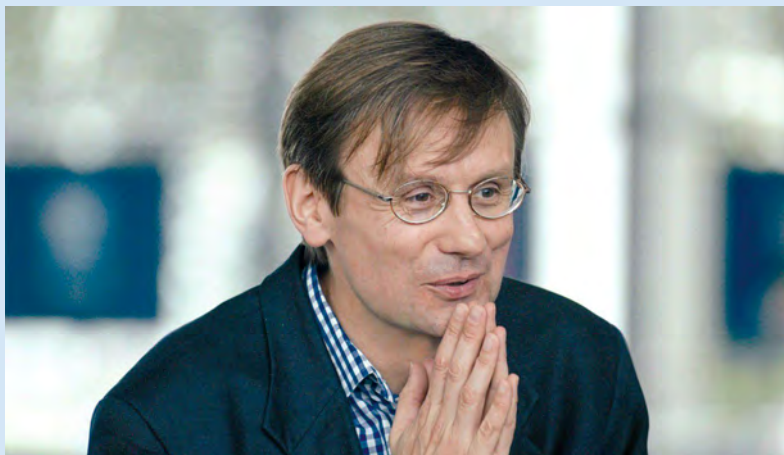
„Singalong“ mit dem britischen Dirigenten Simon Halsey.

Empore ist für die Technik vorbehalten. Wer am Gottesdienst in der Friedenskirche teilnehmen möchte, sollte frühzeitig da sein; letzter Einlass ist um 9 Uhr. Danach werden die Lieder angesungen und die Vorbereitung für die Übertragung abgeschlossen. Nach der Ausstrahlung ist der Fernsehgottesdienst in der ZDF-Mediathek zu finden. mm