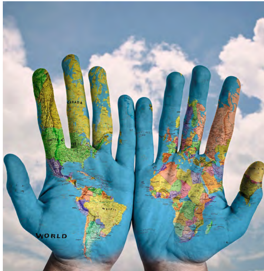
Weltweit gibt es Christen, die verschiedenen Kirchen angehören. Sie alle leben ihren Glauben unterschiedlich. Es entstehen Konflikte, aber die Vielfalt kann auch bereichernd und ermutigend sein.

Schließlich legt Paulus im eingangs erwähnten ersten Korintherbrief noch einen Akzent darauf, dass es nicht kluge Abhandlungen oder schillernde Reden sind, die den Wert und Inhalt des Glaubens bestimmen. Vielmehr ist es Gott selbst, der von sich aus auf uns zugeht und sich in Jesus Christus uns gezeigt hat. Dessen Schicksal am Kreuz, das für Paulus ganz im Mittelpunkt seines Glaubens steht, ist Quelle, Ziel und Inhalt des christlichen Glaubens, in welcher Form auch immer er gelehrt und gelebt wird: „Denn Christus hat mich nicht gesandt zu taufen, sondern das Evangelium zu verkünden, aber nicht mit gewandten und klugen Worten, damit das Kreuz Christi nicht um seine Kraft gebracht wird.“ (1 Kor 1,17)