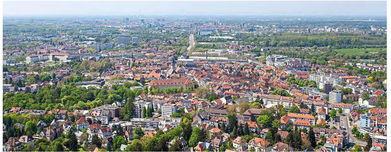
Auf die Besucher aus aller Welt wartet in der Fächerstadt ein vielfältiges Programm. Erwartet werden rund 4.000 internationale Gäste aus den 352 Mitgliedskirchen des ÖRK.

Die Corona-Pandemie hat die Planungen stark beeinträchtigt, sie hat aber auch dazu geführt, nochmals die aktuellen Fragen und Herausforderungen zu