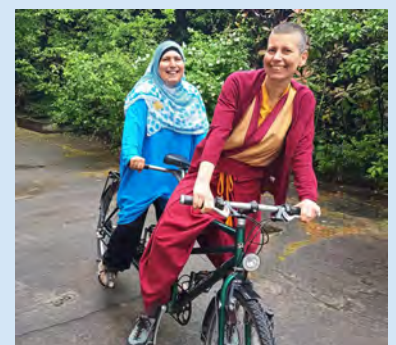
Mit dem Fahrrad geht es zu verschiedenen Religionsgemeinschaften und ihren Gebetshäusern.

Wer mehr über den Garten der Religionen erfahren möchte: Am Samstag, 3. September, gibt es um 11.30 und um 15 Uhr öffentliche Führungen durch den Garten der Religionen. Gründe, Hintergründe und Inhalte der Gartenanlage sowie das Miteinander und interreligiöse Fragestellungen werden erläutert. Die Führung um 11.30 Uhr setzt ihren Schwerpunkt auf die gesamtgesellschaftli-