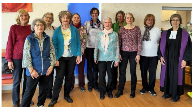
Der Chor „Singen tut gut“ als musikalischer Teil eines Gottesdienstes

Eine Schürze für Jesus, der uns dient; ein Taschentuch für die Tränen, Gott ist wie ein Adler – oder die Frage: wem gehörst du? – das waren u.a. die Themen der diesjährigen Gottesdienste . Es wurde viel gesungen, die altbekannten Texte gesprochen und Segen und Abendmahl ausgeteilt. Seit das Haus Schmitz im März geschlossen wurde, sind es noch vier Einrichtungen, die ich regelmäßig betreue. Vier Gottesdienste im Monat, dazu Besuche und Gespräche, auch einige Bestattungen.